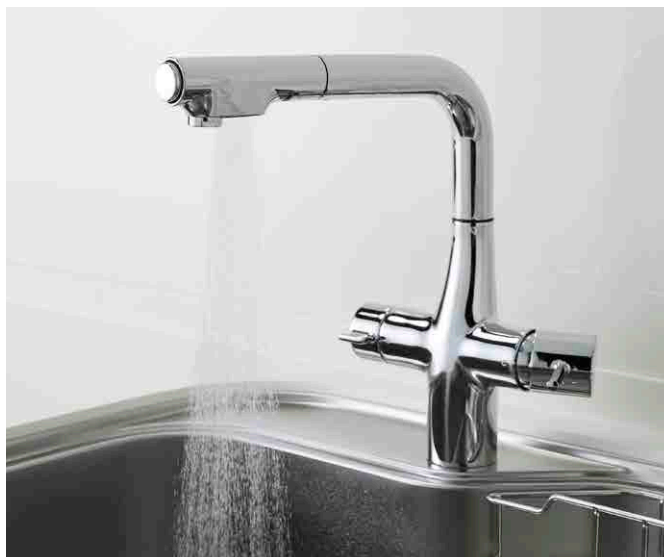
※写真は浄水器兼用タイプです。